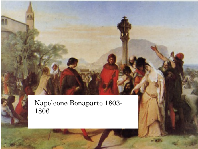
Napoleone Bonaparte 1803-1806