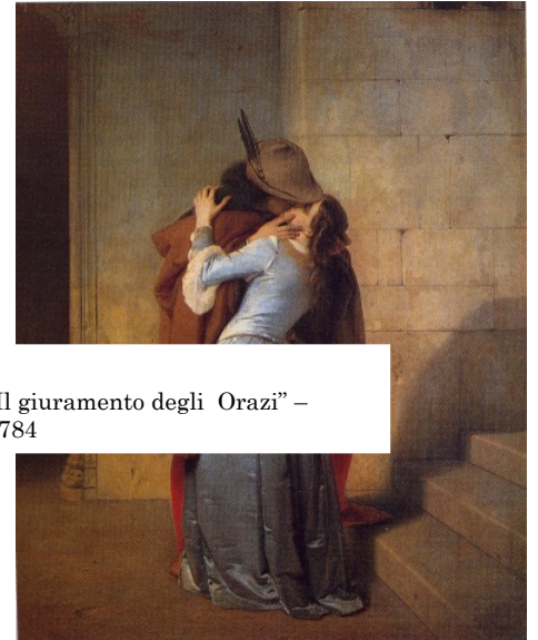
"Il giuramento degli Orazi" – 1784